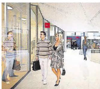
COS, sera installé sur les deux niveaux du passage.