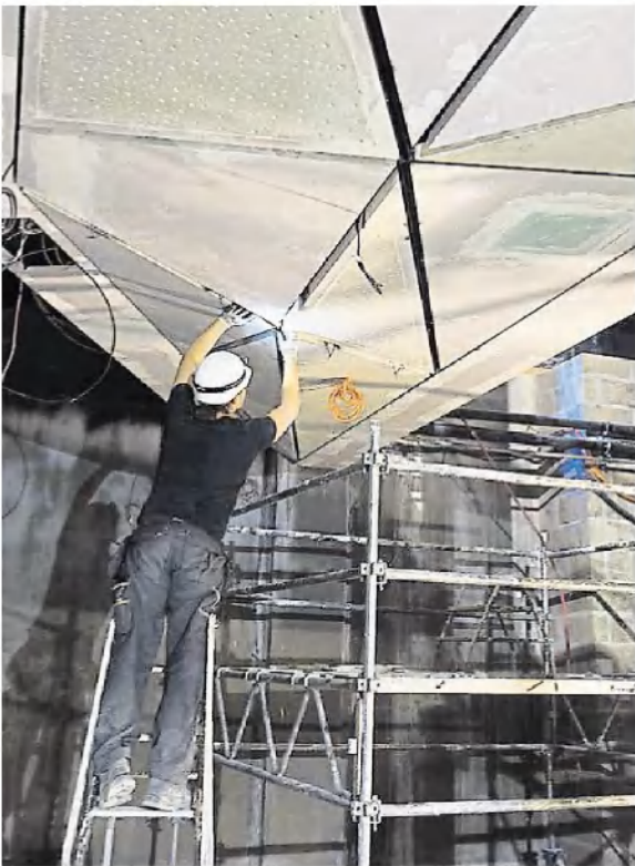
400 m 2 de faux plafonds en plaques de plâtre sont posés dans le nouveau passage de la Châtelaine.