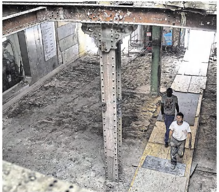
Les éléments d'une ancienne charpente métallique de type Eiffel ont été mis au jour lors des travaux et doivent être mis en valeur dans le cadre du nouveau passage.